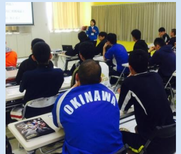
高校生対象講演(筋力UPについて)