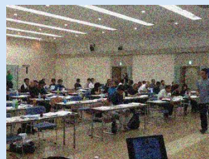
指導者対象(スポーツ栄養学)